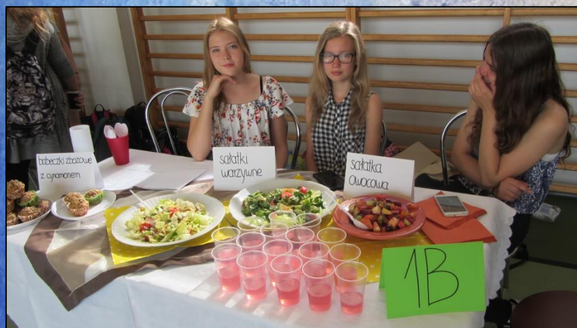
Targi Zdrowej Żywności