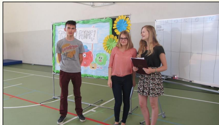
akcja „Trzymaj Formę!”