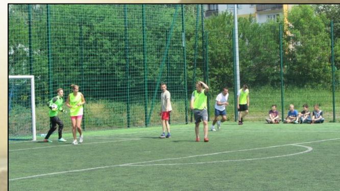
zawody sportowe na Orliku