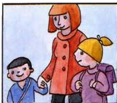
A) Die Kinder abholt und nach Hause gebracht