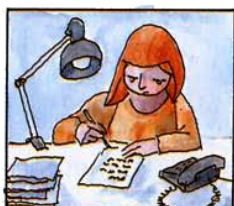
H) Briefe beantwortet, telefoniert, Bestellungen bearbeitet