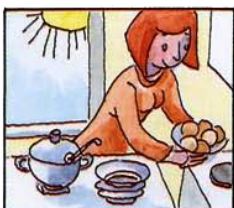
I) Das Mittagessen gekocht