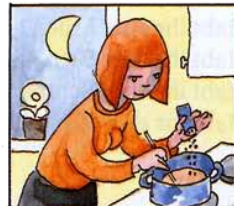
D) Abendessen gekocht