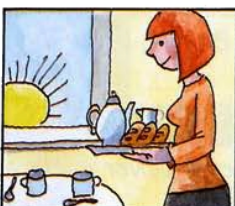
G) Das Frühstück gemacht