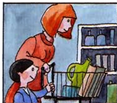
B) In den Supermarkt gegangen, Jens mitgenommen