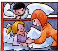
F) Die Kinder ins Bett gebracht