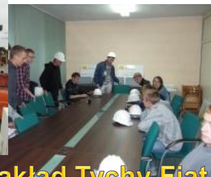
Zakład Tychy Fiat Auto Poland