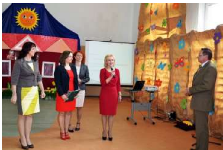
fot. Wręczenie raportu w Szkole Podstawowej im. Jana Korczaka w Kraplewicach

Analiza danych wykazała, że szkoły i placówki w naszym województwie osiągają wysokie wyniki spełniania wymagań określonych przez państwo. Jednak w tym roku pojawiły się szkoły, które spełniły te wymagania w stopniu bardzo niskim, zwłaszcza w zakresie „Uczniowie nabywają wiadomości i umiejętności określone w podstawie programowej” oraz „Zarządzanie szkołą lub placówką służy jej rozwojowi”. Szkoły te zostały zobowiązane do opracowania i wdrożenia programów naprawczych. W ramach sprawowanego nadzoru pedagogicznego przeprowadzono 424 kontrole planowe tj. 16% nadzorowanych szkół i placówek. Sprawdzano min. funkcjonowanie świetlicy szkolnej, zapewnienie bezpieczeństwa uczniom w czasie pobytu w szkole oraz działania organizacyjne dyrektora szkoły umożliwiające obrót używanymi podręcznikami na terenie szkoły. Wyniki świadczą, że nastąpiła zdecydowana poprawa w przestrzeganiu prawa przez szkoły. Kujawsko-Pomorski Kurator Oświaty wyraża swoje uznanie za zorganizowanie spotkań z całą społecznością szkolną podczas wręczania raportów. Jest to okazja do upowszechniania ewaluacji jako sposobu podnoszenia jakości pracy szkół. Ponadto rodzice, nauczyciele, uczniowie i partnerzy szkoły poznają mocne strony szkoły oraz rekomendacje służące do planowania dalszej pracy oraz rozwoju szkoły.