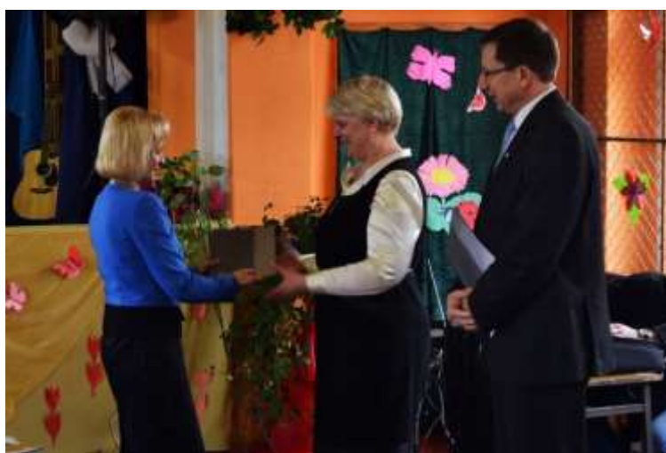
fot. Wręczenie raportu w Szkole Podstawowej w Polanowicach