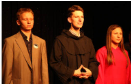
Aktorzy teatru AZYL z Inowrocławia