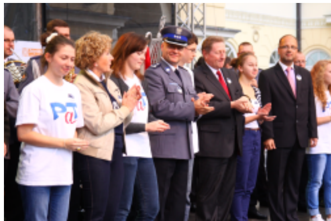
Uroczyste otwarcie Warszawskiej Nocy Profilaktyki

Wprowadzić noc ta trwała tylko parę godzin, jednak – jak przystało na społeczność programu PaT – przebiegała w szalonym tempie. Happeningi, spektakle, taniec, Profilaktyczna Gra Miejska, koncerty – każdy mógł znaleźć coś dla siebie.