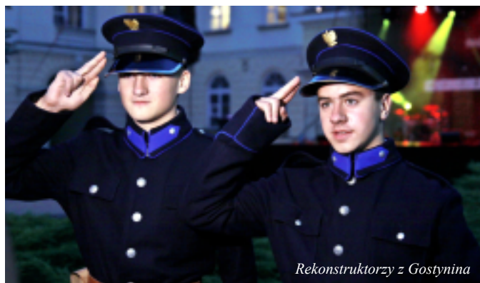
Rekonstruktorzy z Gostynina