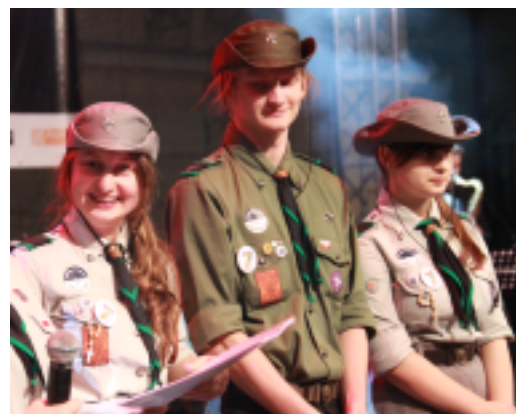
Harcerze z Sokołowa Podlaskiego